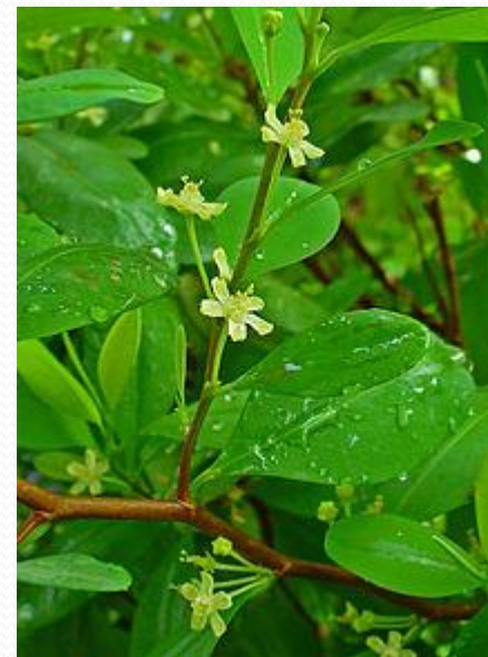
Rudodřev koka, zdroj přírodního kokainu