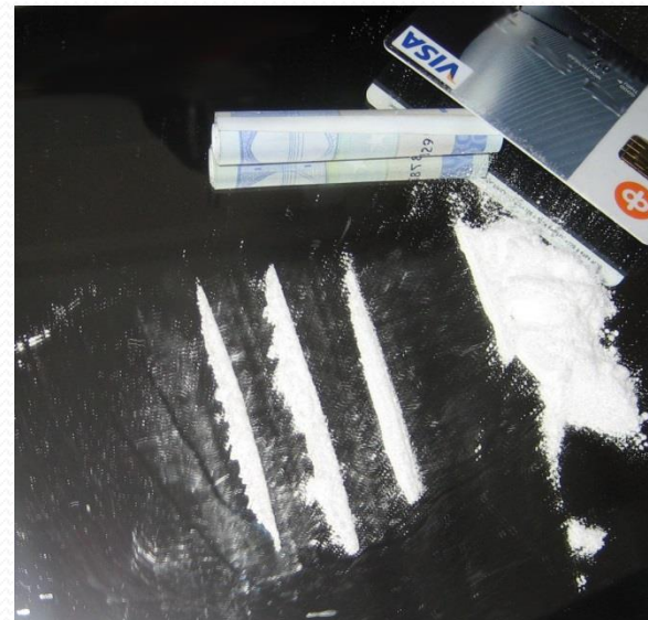
Kokain hydrochlorid připravený ke šňupání